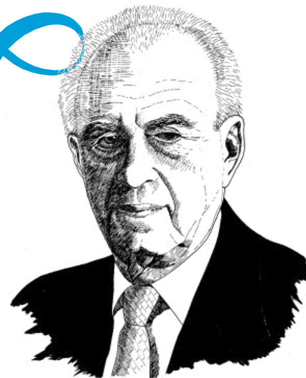
Heroes of Israel (ii) Yitzhak Rabin c.1992 ©Neil Gfash 4/4/11

"ביטחון איננו רק הטנק, המטוס וספינת הטילים. ביטחון הוא גם, ואולי אף קודם כל האדם – האדם, האזרח הישראלי. ביטחון הוא גם החינוך של האדם, הוא הבית שלו, הוא הרחוב והשכונה שלו, הוא החברה שבתוכה צמח. וביטחון הוא גם התקווה של האדם."