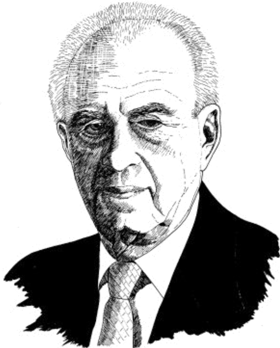
Hero of Israel (vi) Yitzhak Rabin c.1992 © Nabil Ezzamel 4/4/11