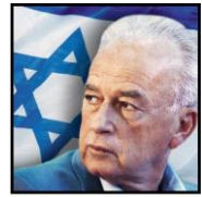
מרכז יצחק רבין The Yitzhak Rabin Center

מדינת ישראל משרד החינוך המזכירות הפדגוגית המטה ליישום דוח קרמניצר