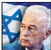
מרכז יצחק רבין The Yitzhak Rabin Center