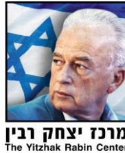
מרכז יצחק רבין The Yitzhak Rabin Center

כיום, במרכז מספר סוגים של פעילויות לילדים צעירים: הצגות הילדים, פעילות "המרוץ למדינה", סדנת פעילות בנושא "תעודת זהות" ו"הכרזת העצמאות"; סדנת "הבול שלי"; סדנת מנהיגות, סדנת "המגשר הצעיר" העוסקת בשאלה "חבר לעומת יריב"; ופעילות במתחם "משחקי הענק".