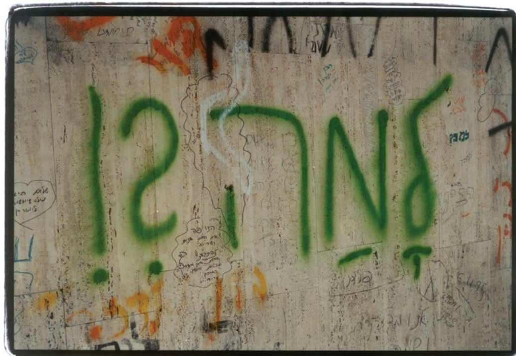
כתובות על קיר הגרפיטי מול מקום הרצח