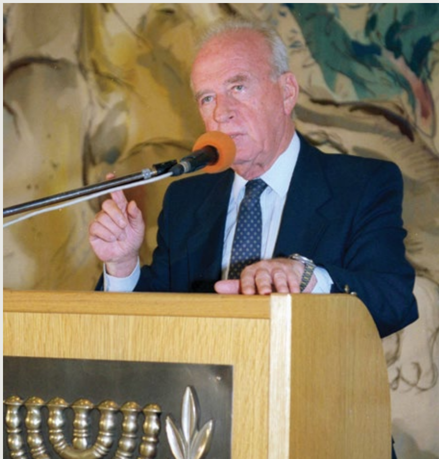
ראש הממשלה בנאום בכנסת

[ נאום בפני נציגי הפדרציות היהודיות בארצות הברית, 1994 ]