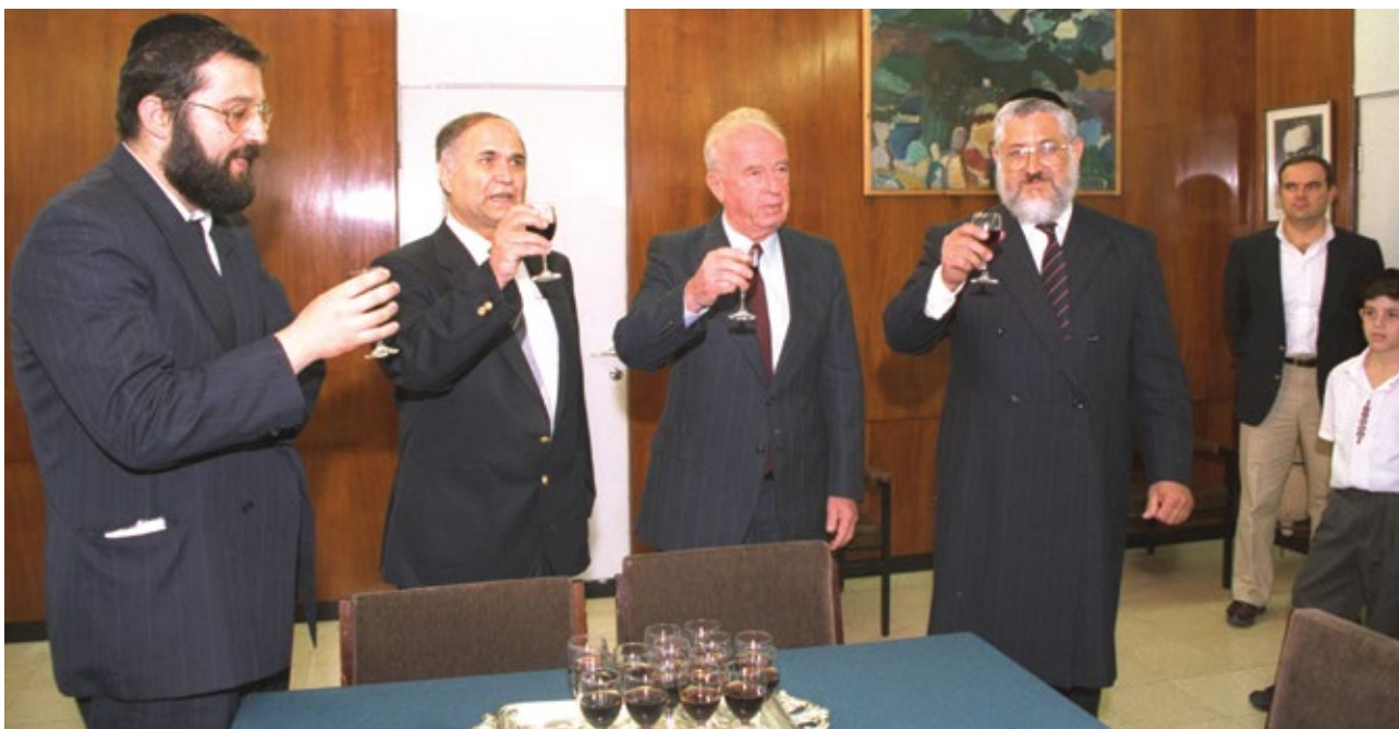
בטקס במשרד הדתות, 1992