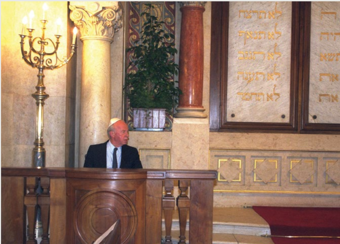
בבית הכנסת במוסקבה, 1994

[ נאום בבאזל, במלאת שבעה עשורים לקונגרס הציוני הראשון, 1967 ]