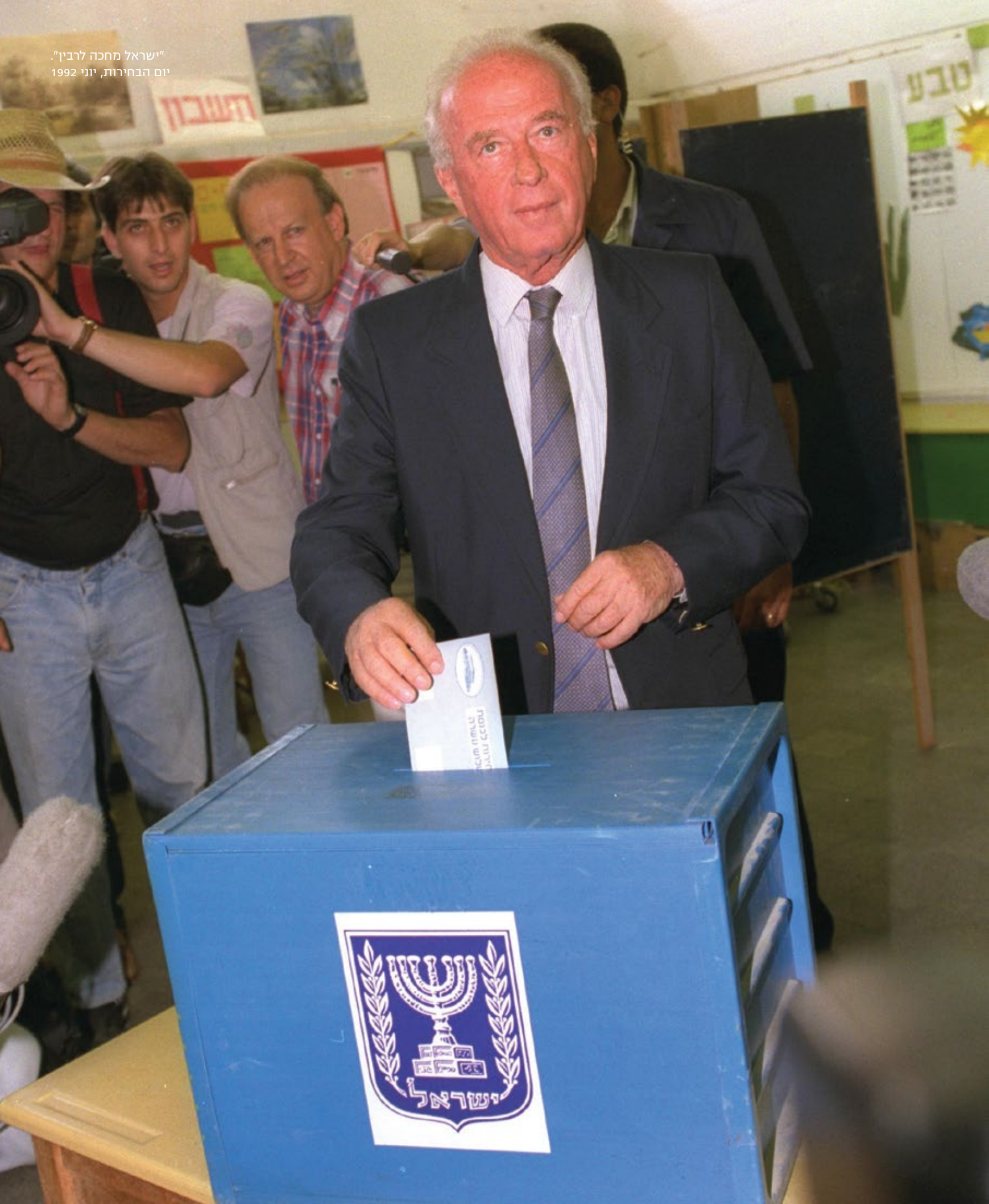
"ישראל מחכה לרבין" יום הבחירות, יוני 1992