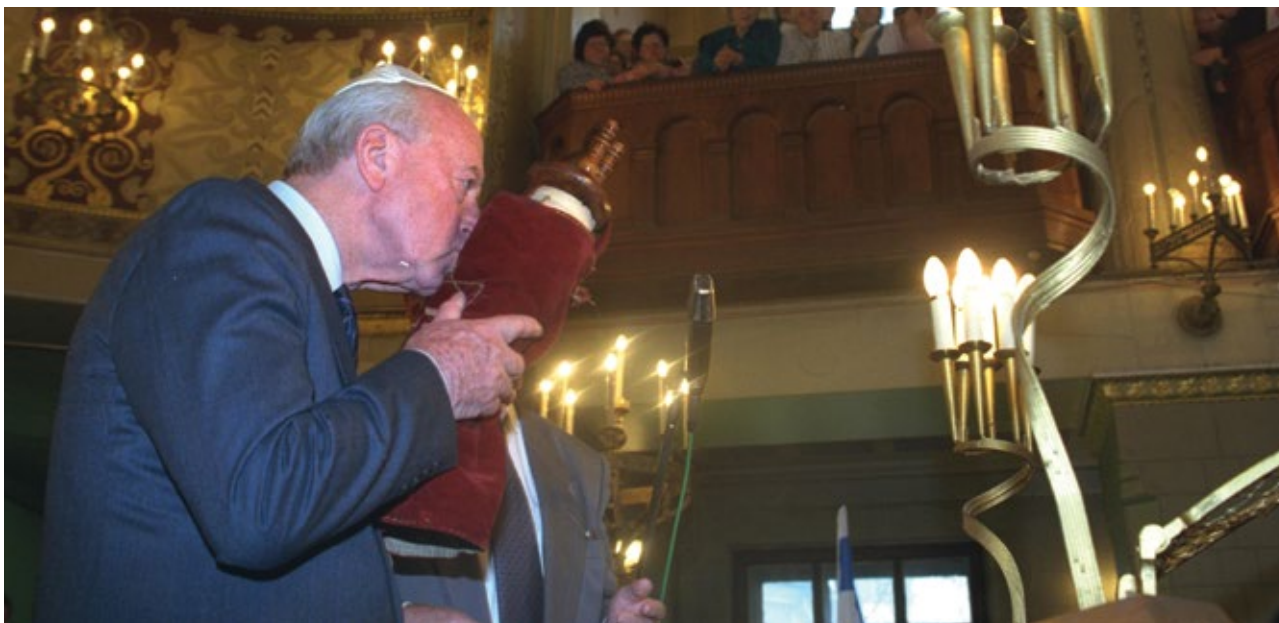
מול ארון הקודש בבית הכנסת במוסקבה

רבין רצה בהסדר מדיני כדי לשמר את יכולתם של יהודים לחיות בחלק ממולדתם בתנאים של עצמאות מדינית מלאה. הוא סבר שהן מבחינת סיכוייה של ישראל להתקיים כמדינה יהודית ודמוקרטית והן מבחינה מוסרית, עדיף הסדר הגון עם שכנינו, המכיר בזכויותיהם ועומד על הבטחתנו אלה, על פני מלחמת-תמיד.