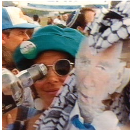
ראש הממשלה על הכוונת: כרזות נגד יצחק רבין בהפגנות ימין