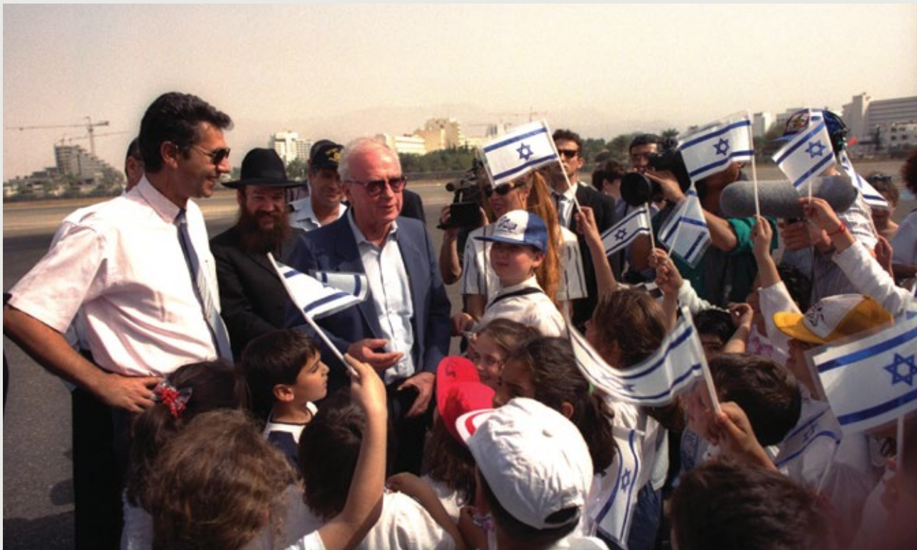
קבלת פנים לראש הממשלה בשדה התעופה באילת, 1993

[ נאום בישיבה הראשונה של הכנסת ה-13, יולי 1992 ]