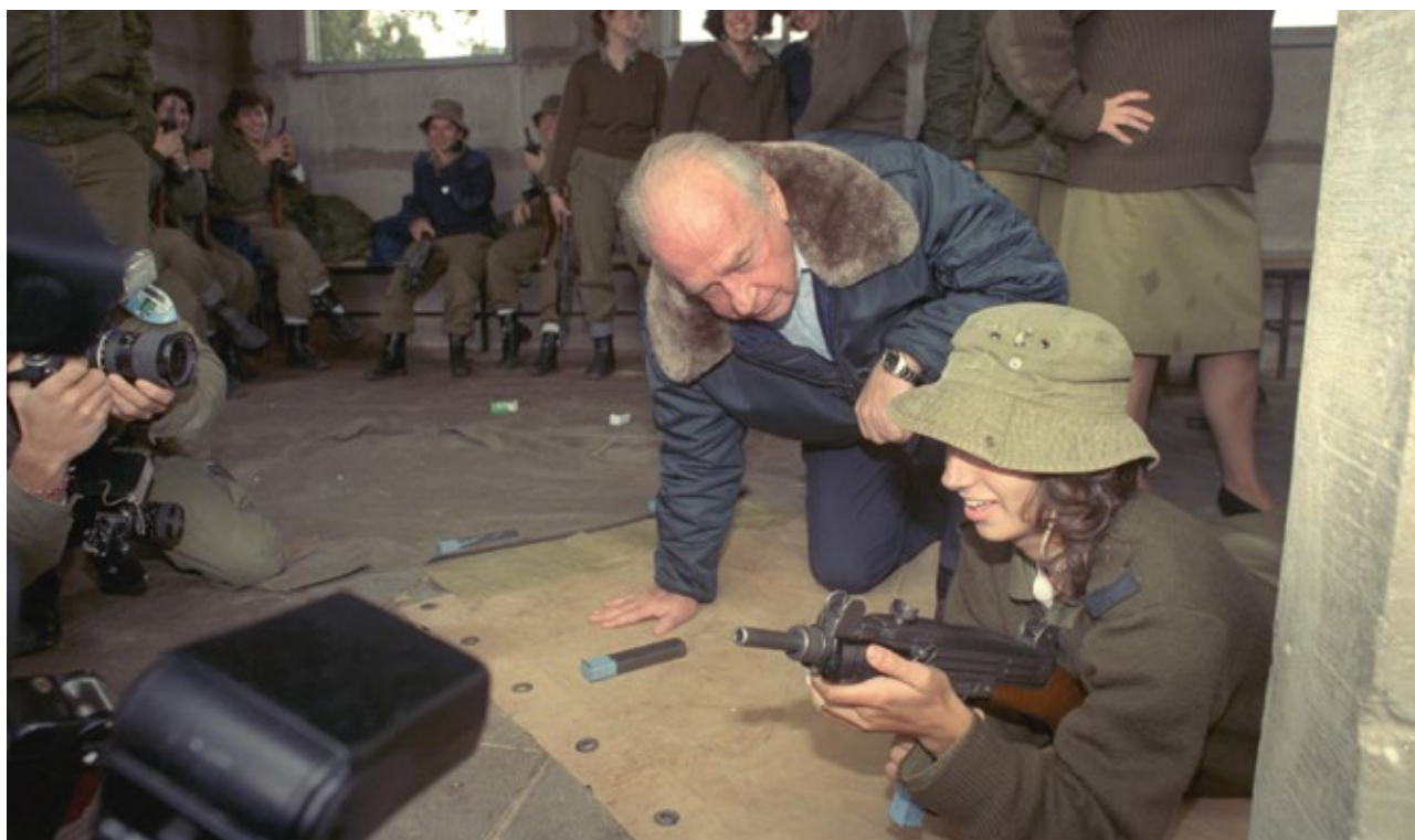
שר הביטחון רבין בבסיס הדרכה בצריפין 1989

"באתוס הצה"לי טבועים שמות של מורי דרך, של מורי הלכה ושל מחוללי המפעלים הגדולים אצלנו. באתוס הזה טבוע גם שמו של יצחק לתמיד, כל זמן שצה"ל יהיה קיים"