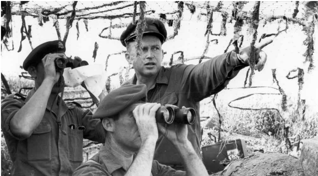
אלוף פיקוד הצפון, יצחק רבין, בגבול הסורי, 1958

הגם שחלום נעוריו היה ללמוד הנדסת מים, ולתרומם למדינה בתחום בו היתה מצוקה גדולה, נרתם ללחימה באויב משום שהבין כי זו שעה גדולה וחשובה למדינה שנאבקת על הקמתה.