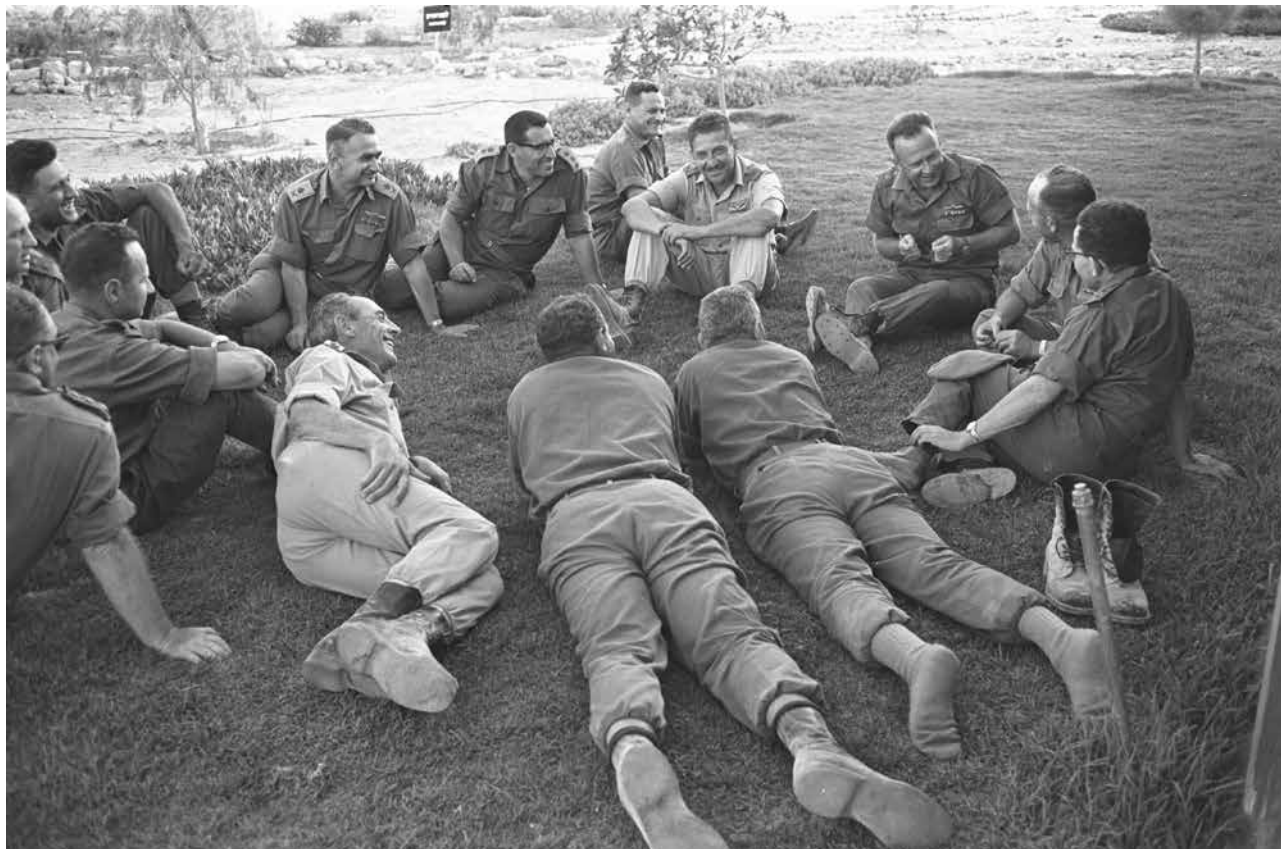
הרמטכ"ל רבין וקצינים בכירים, במהלך הפוגה בתרגיל בדרום. 1964

מאז, ולמשך יותר מארבעים שנה אחר כך, מילא יצחק רבין תפקיד מכריע בעיצוב תורת הביטחון הישראלית ומדיניות הביטחון הלאומי של ישראל. רבין מילא שורה ארוכה של תפקידי מפתח בצה"ל, והטביע את חותמו בתחומים מגוונים – בין השאר כראש מחלקת המבצעים, כאלוף פיקוד הצפון, כראש אג"ם וכסגן הרמטכ"ל. בינואר 1964 החל את כהונתו