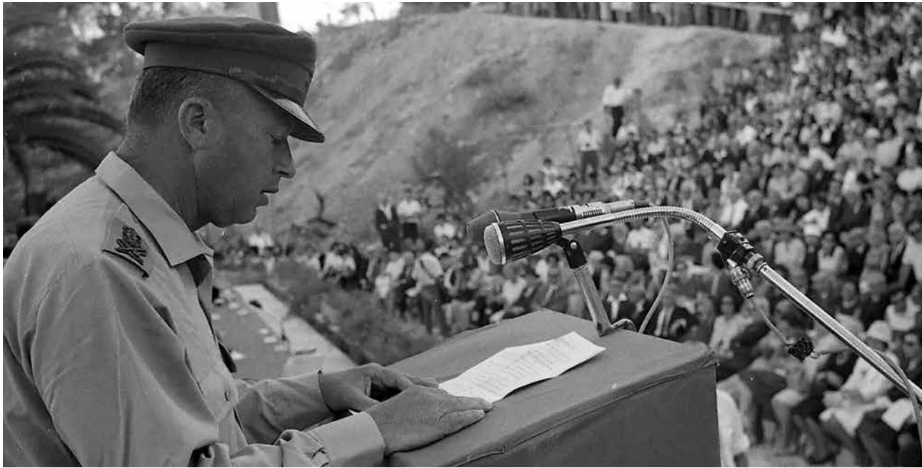
הרמטכ"ל רבין במעמד הר הצופים. יוני 1967

המכלול, כמו גם מההקפדה על הפרטים. האלוף ישראל טל התייחס ליכולות אלה כשספד לו: