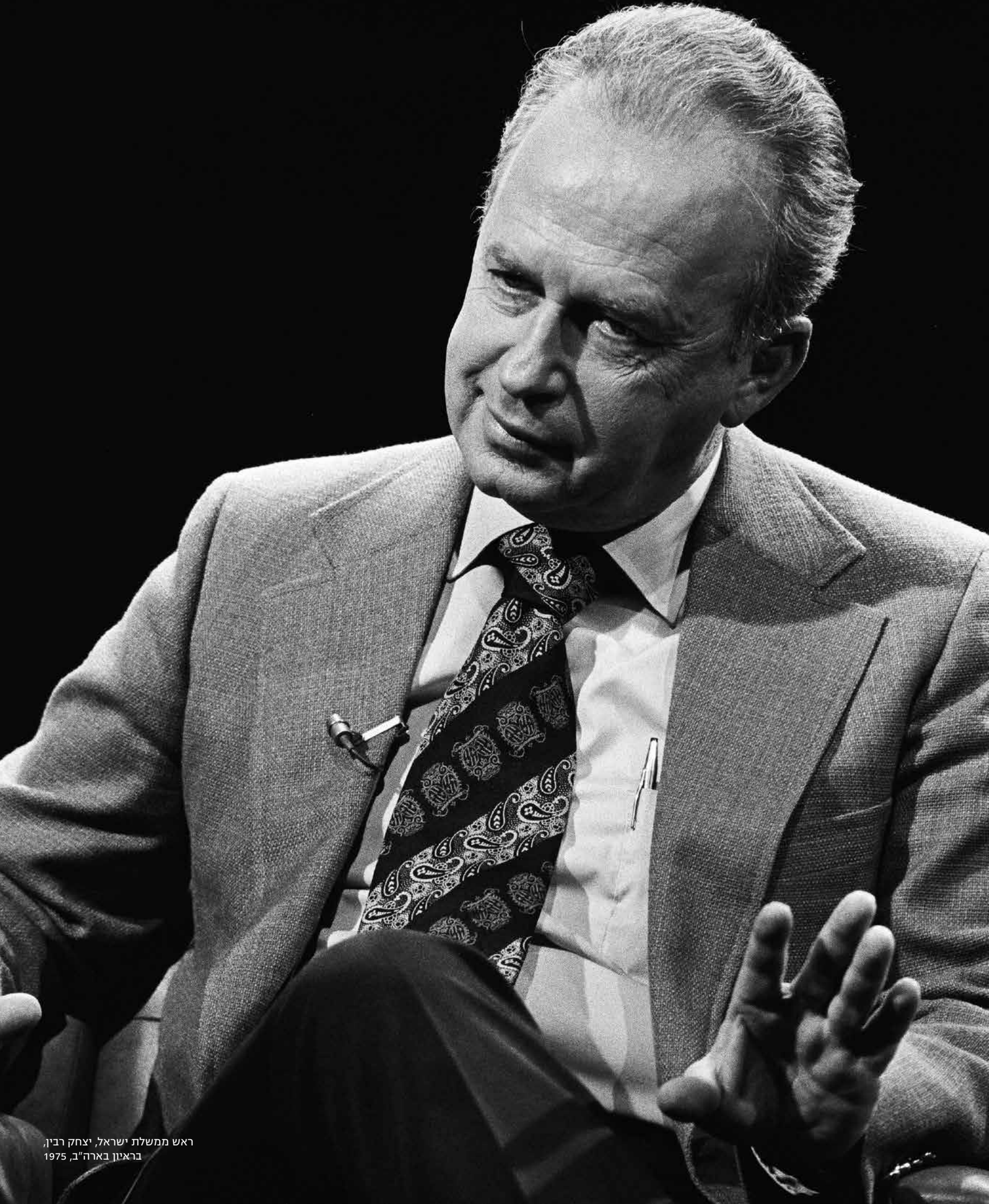
ראש ממשלת ישראל, יצחק רבין, בראיון בארה"ב, 1975