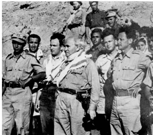
עם בן גוריון ואחרים בסיומה של מלחמת העצמאות