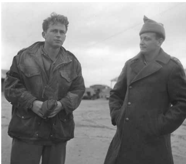
עם מפקד הפלמ"ח, יגאל אלון

בזמן לימודיו ב"כדורי" הצטרף יצחק רבין לארגון ה"הגנה". תפקידו של הארגון היה להגן על היישוב היהודי בארץ מפני התנכלויות של הערבים. את לימודיו ב"כדורי" סיים בהצטיינות. מנהל בית הספר סייע לו לקבל מלגה ללימודי הנדסה באוניברסיטה בארצות הברית, אך יצחק רבין סירב לקבל את המלגה שהוצעה לו, וטען שבעת מלחמה - מלחמת העולם השנייה - אין זה מן הראוי שיעזוב את הארץ. אחרי שוויתר על לימודים בחוץ לארץ כדי להתגייס להגנת הארץ, הצטרף רבין בן ה-19 לפלמ"ח (פלוגות מחץ, כוח הקבע המגויס של ארגון ה"הגנה"), התקדם בשירותו ומונה למפקד. באותה התקופה גובשה תפיסת הלחימה המיוחדת של הפלמ"ח, שהעדיפה יוזמה, מקוריות וחשיבה עצמאית על פני שגרת אימונים מסודרת.