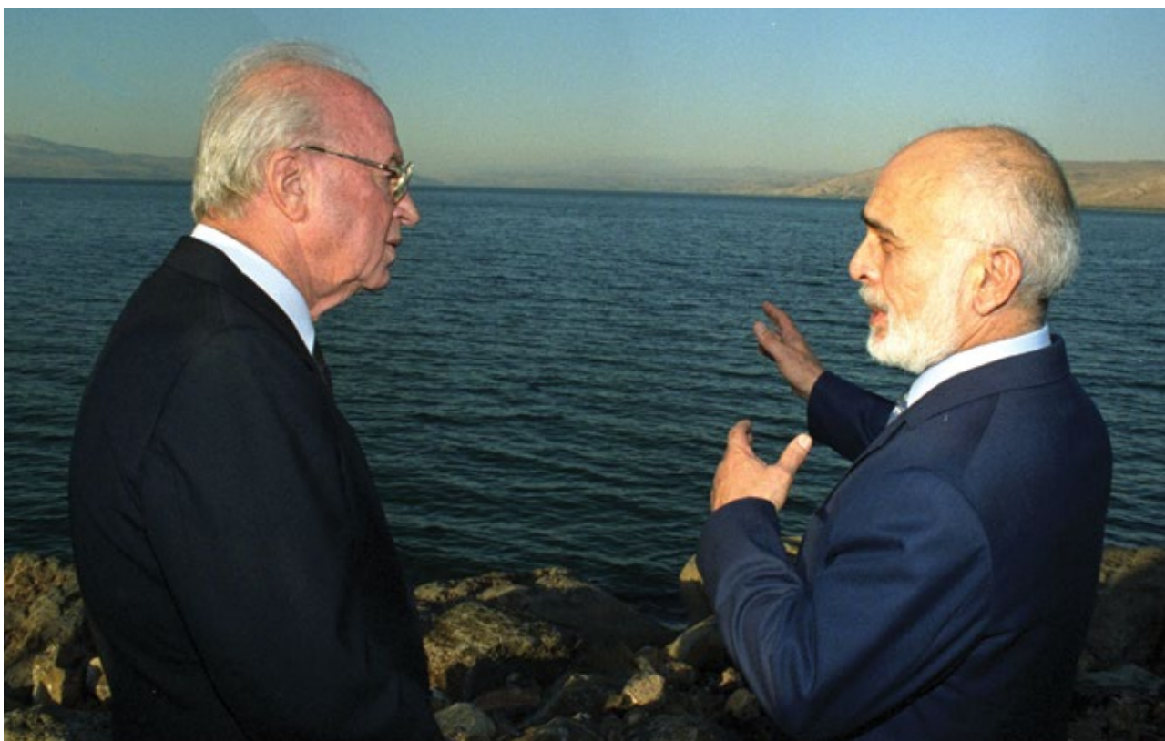
על שפת הכנרת עם חוסיין מלך ירדן, 1994