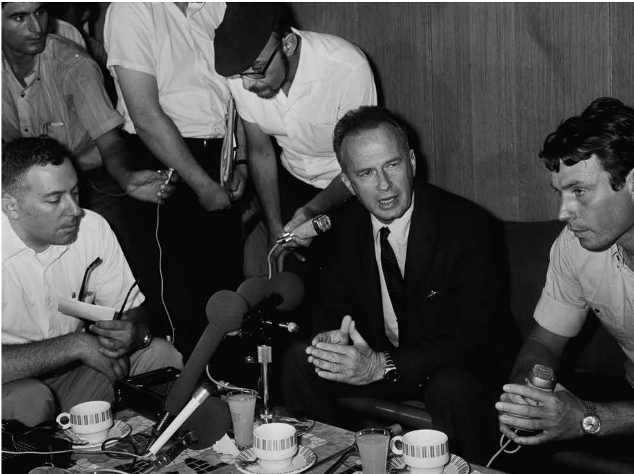
שגריר ישראל בושינגטון, יוני 1970

בתחילת 1968, לאחר 27 שנות שירות צבאי, פרש יצחק רבין מצה"ל והתמנה לתפקידו החדש - שגריר ישראל בארה"ב. בתפקיד זה כיהן חמש שנים וחזר לארץ בשנת 1973, השנה בה פרצה מלחמת יום הכיפורים. במלחמה הקשה נפלו 2,297 חיילים. אחרי המלחמה, התעוררה תסיסה בארץ נגד הממשלה, בגלל מחדלה בהכנת הצבא למלחמה. ראש הממשלה גולדה מאיר התפטרה מתפקידה. לאחר התפטרותה, בחרה מפלגת העבודה ביצחק רבין לעמוד בראש המפלגה במקומה. רבין כיהן כראש ממשלה בשנים 1974-1977. הישגיו הבולטים בקדנציה זו היו שיקום צה"ל וכלכלת ישראל לאחר משבר מלחמת יום הכיפורים; חתימת הסכם הביניים עם מצרים, שהיווה נדבך להסכם השלום שנחתם מאוחר יותר; והמבצע המזהיר באנטבה לשחרור החטופים הישראלים. בבחירות של 1977 ניצחה מפלגת הליכוד, ויצחק רבין, חבר מפלגת העבודה, המשיך לשמש כחבר כנסת. בשנת 1984 הוקמה ממשלת אחדות משותפת לליכוד ולעבודה, והוא מונה לשר ביטחון. האינתיפאדה, התקוממות הפלסטינים בשטחים, פרצה בשנת 1987. חיילי צה"ל נאלצו להילחם באזרחים. תחילה סברו גם הישראלים וגם הפלסטינים, כי ההתקוממות תהיה קצרת מועד, אך לא כך היה. יצחק רבין הורה לחיילי צה"ל לפעול בתקיפות נגד התקפות הפלסטינים. בה בעת ראה באינתיפאדה שיעור חשוב בדבר מגבלות כוחה של ישראל ובדבר ההכרח בתהליך מדיני, שישים קץ לסכסוך הדמים.