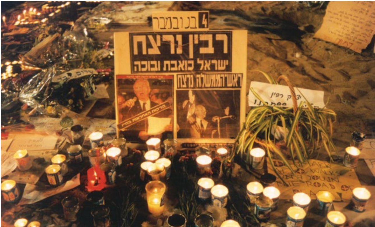
גלעדים מאולתרים ונרות זיכרון בכיכר מלכי ישראל, נובמבר 1995