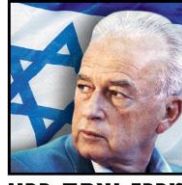
מרכז יצחק רבין The Yitzhak Rabin Center