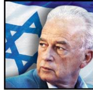
מרכז יצחק רבין The Yitzhak Rabin Center