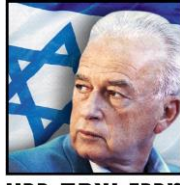
מרכז יצחק רבין The Yitzhak Rabin Center