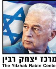
מרכז יצחק רבין The Yitzhak Rabin Center